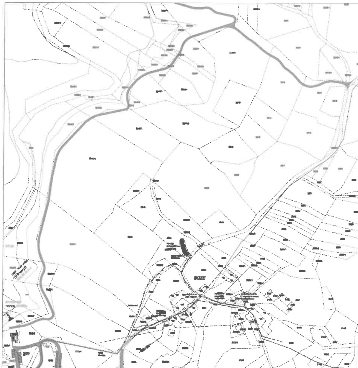
Slika 2: situacijski načrt »Povezovalna pot med območjema Mola – jug in Mola - Sever«